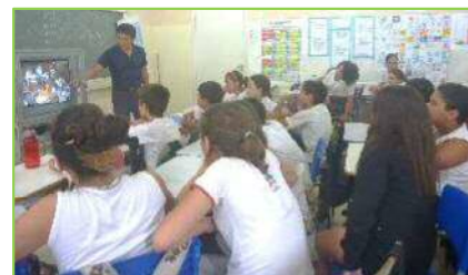
【動画に見入る5年生】

昨年度の向山小学校に続いて、岩西小学校と幸小学校にご協力をいただいて作成した、小学校生活の一日（動画）を5年生に視聴してもらいました。朝の登校風景が始まると、子どもたちは前のめりになって見入っていました。